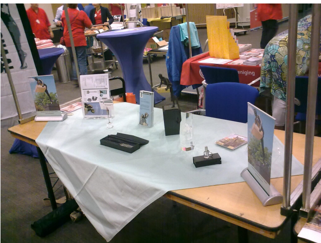
NDM-stand in afwachting van de eerste bezoekers