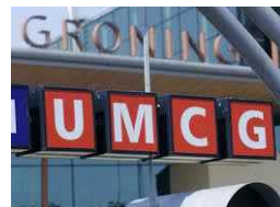
Ook in het UMCG staat een replica van De Klim

Om een grotere bekendheid te creëren en om voor iedereen een persoonlijk bezoek mogelijk te maken, is daarom aan elk transplantatiecentrum in Nederland een replica van het monument aangeboden. Dáár ko-